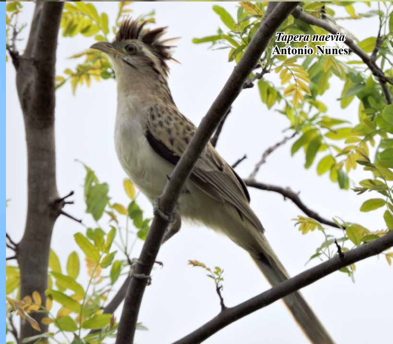
Tapera naevia Antonio Nunes