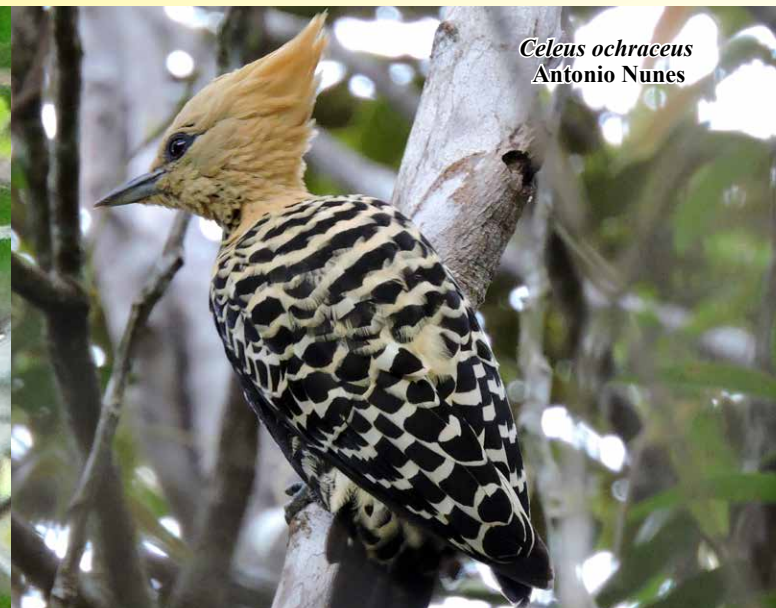
Celexus ochraceus Antonio Nunes