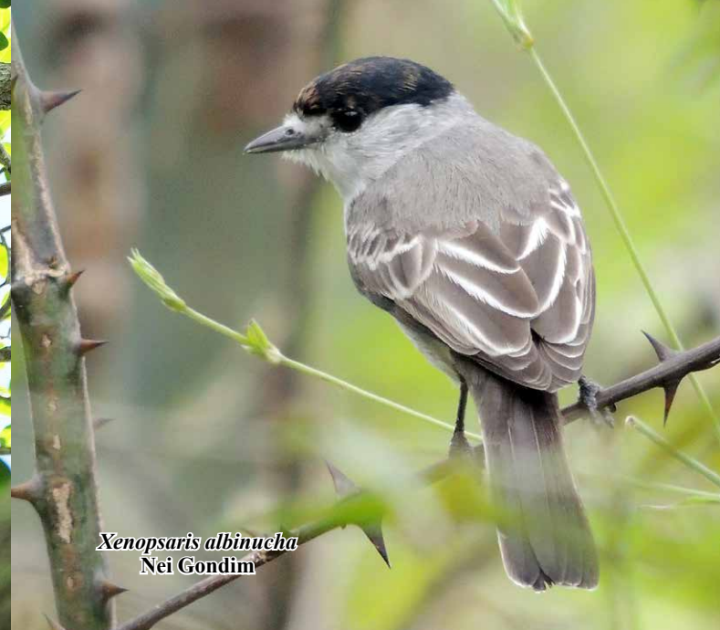
Xenopsaris albinucha Nei Gondim