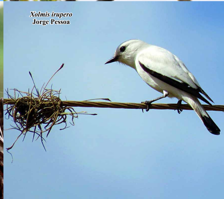
Xolmis irupero Jorge Pessoa