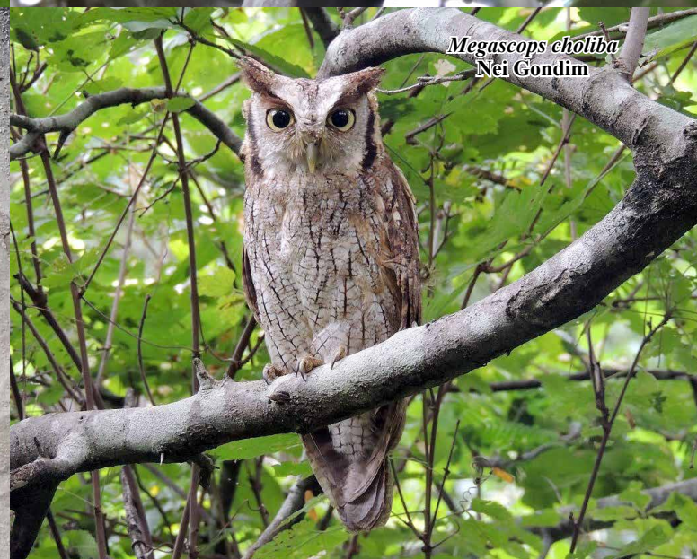
Megascops choliba Nei Gondim