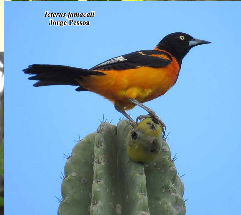
Icterus jamaicaii Jorge Pessoa