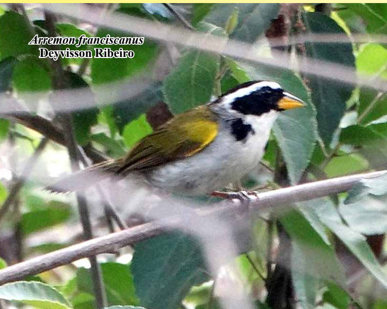
Arremon franciscanus Deyvisson Ribeiro