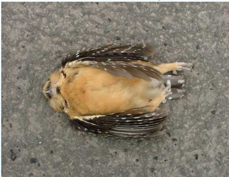
Fig. 2: Vista ventral do indivíduo coletado.