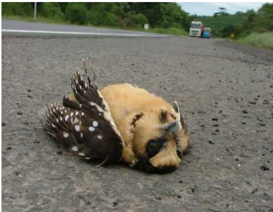
Fig. 1: Aegolius harrisii atropelado na BR-280, bem próximo à divisa com o estado de Santa Catarina.

Até então, excetuando-se a coleta efetuada no Parque Estadual João Paulo II, localizado na área urbana de Curitiba, todos os registros da espécie no Estado foram obtidos em locais caracterizados pela Floresta Ombrófila Mista Aluvial, com predomínio de branquilha ( Sebastiania commersoniana ). Esse ambiente trata-se de uma formação ribeirinha sujeita a inundações periódicas, constituindo as florestas ripárias que ocupam terrenos situados junto aos cursos d'água (PIRES et al. , 2005). Caracteriza-se estruturalmente por uma elevada densidade de plantas de médio e pequeno porte, com o dossel entre 10 e 15 m, variando desde associações quase homogêneas, onde o branquilha é a espécie dominante, até associações mais evoluídas, onde a ele se juntam a corticeira ( Erythrina falcata ), o tarumã ( Vitex megapotamica ), a aroeira ( Schinus terebinthifolius ), o vacum ( Allophylus edulis ), o açoita-cavalo ( Luehea divaricata ), a maria-mole ( Symplocos uniflora ), a murta ( Blepharocalyx salicifolius ) e o jerivá ( Syagrus romanzoffiana ). O sub-bosque desta formação é geralmente caracterizado pela presença do cambuizinho ( Myrciaria tenella ), do guamirim-ferro ( Calyptanthes concinna ) e também da embira ( Daphnopsis ra-