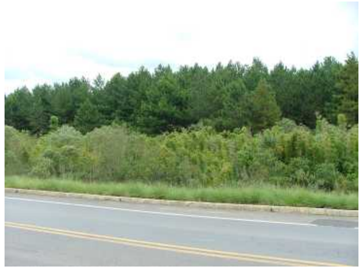
Figs. 3 e 4: Ambiente em que a ave foi encontrada, bastante diferente do conhecido anteriormente para a espécie em território paranaense. Um talhão de Pinus existe em um dos lados da estrada, enfatizando a possível relação de A. harrisii com esta árvore exótica.

cemos ) (KLEIN e HATSCHBACH, 1962; LEITE e KLEIN, 1990; IBGE, 1992; RODERJAN et al. , 2002; PIRES et al. , 2005; BLUM, 2008).