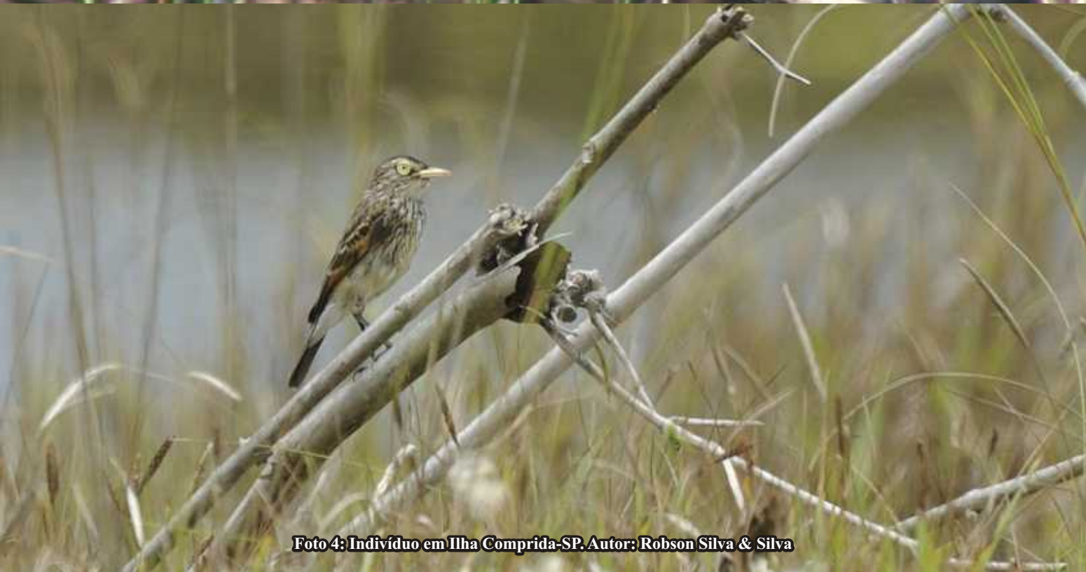
Foto 4: Indivíduo em Ilha Comprida-SP.