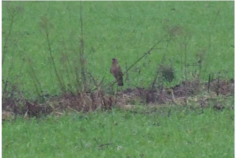
Figura 1. Chimango Milvago chimango fotografado no município de São Mateus do Sul (26°00'20"S e 50°29'45"W) no dia 25 de julho de 2009.

As menções de M. chimango no Paraná concentram-se tradicionalmente no litoral (Moraes 1991, Moraes & Krul 1995, Straube et al. 2004), embora haja uma citação não substanciada no Parque Nacional do Iguaçu (Koch & Bóçon 1994; Figura 2). Sua presença em outros locais da costa oeste paranaense, no entanto, é provável, po-