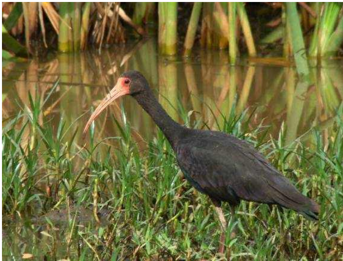
Figura 4: Phimosus infuscatus , registrado na Lagoa da Pampulha, Belo Horizonte, MG.