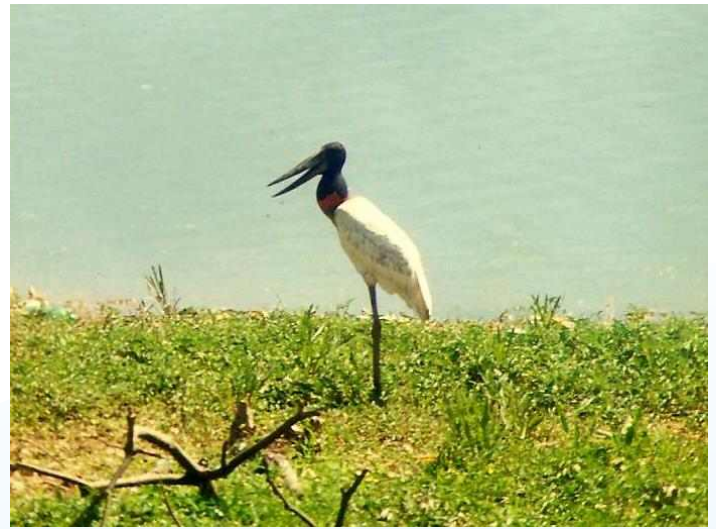
Figura 5: Jabiru mycteria , registrado na Lagoa da Pampulha, Belo Horizonte, MG.

ma Cerrado e por uma mata ciliar que circunda uma lagoa de 2,2 ha formada pelo represamento de três nascentes. O córrego do Nado é um afluente do córrego Vilarinho, que deságua no ribeirão do Onça, unindo-se ao rio das Velhas, integrante da bacia do rio São Francisco (PBH 2009). Altitude entre 770 e 800 metros (SIAM 2009).