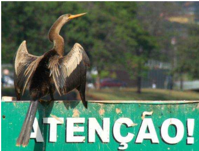
Figura 2: Anhinga anhinga , registrada na Lagoa da Pampulha, Belo Horizonte, MG.