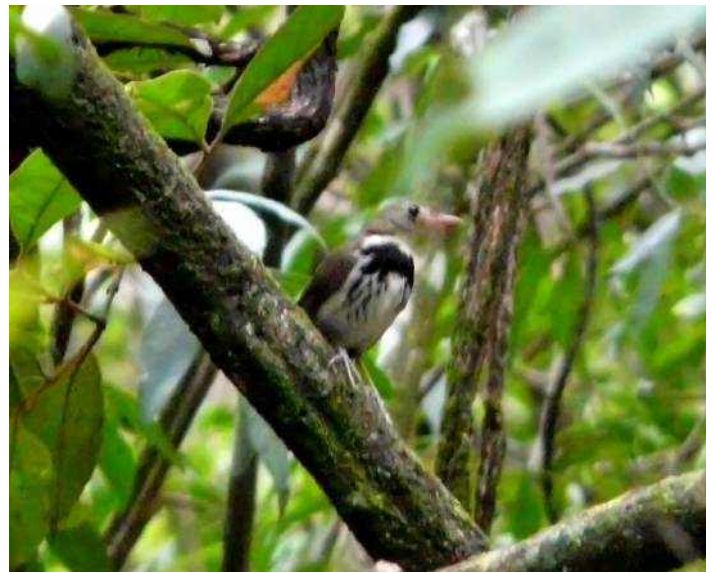
Figura 7: Corythopsis delalandi , registrado no Parque das Mangabeiras, Belo Horizonte, MG.