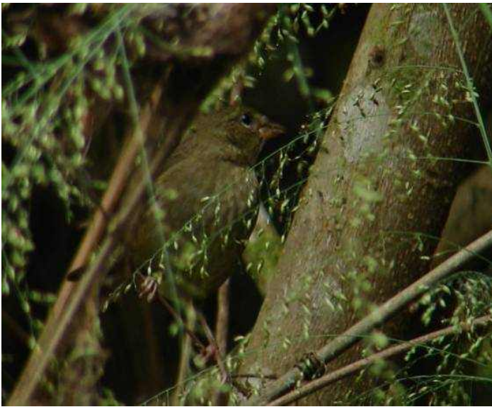
Figura 10: Haplospiza unicolor , registrada no Parque das Mangabeiras, Belo Horizonte, MG.

mente pela vocalização, após emitir suas estrofes trissilábicas e, quando mais próximo, pelo seu estalido, que lhe confere o nome popular de estalador. Cogita-se a hipótese de um casal, pois demonstravam comportamento reprodutivo e de defesa territorial. Outros registros para a espécie ocorreram no mesmo local em datas recentes, o que leva a crer que são residentes e fiéis ao seu território.