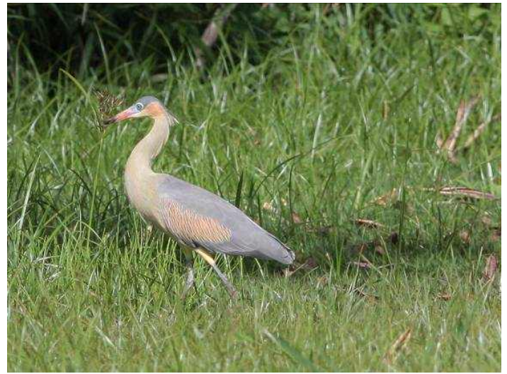
Figura 3: Strygma sibilatrix , registrada na Lagoa da Pampulha, Belo Horizonte, MG.