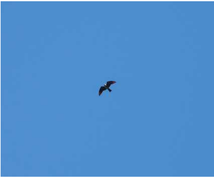
Figura 6: Ictinia plumbea , registrado no Parque das Mangabeiras, Belo Horizonte, MG.