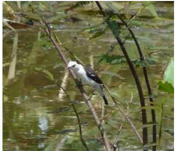
Figura 9: Fluvicola albiventer , registrado na Lagoa da Pampulha, Belo Horizonte, MG.

as adjacentes ao ponto de registro, foram realizados em datas recentes, o que indica a presença constante da espécie naquela localidade.