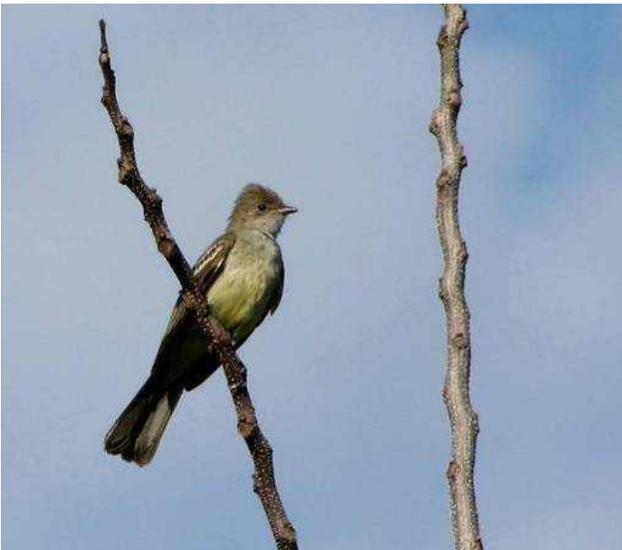
Figura 8: Elaenia spectabilis , registrado no Parque Roberto Burle Marx, Belo Horizonte, MG.