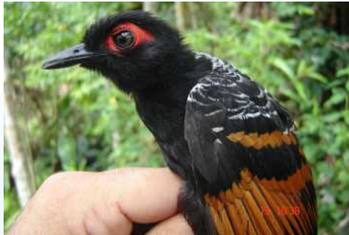
Figura 8 - Phlegopsis erythroptera ( Thamnophilidae ). Espécie endêmica, capturada no Ponto 4 (07°53'32,6"S; 71°39'44,6"W)