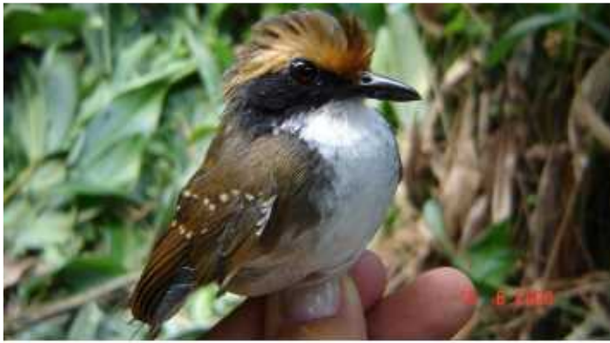
Figura 7 - Myrmoborus leucophrys – fêmea - ( Thamnophilidae ). Aves capturadas no Ponto 1 (07°48'50,9"S; 72°01'37,0"W), dentro da Floresta Estadual do rio Liberdade