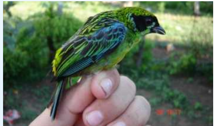
Figura 9 - Tangara schrankii ( Thraupidae ). Espécie endêmica, capturada no Ponto 9 (08°04'04,6"S; 71°10'37,0"W), dentro da Floresta estadual do Rio Gregório

2 Aluno de doutorado do Curso de Pós-Graduação em Zoologia do Museu Paraense Emílio Goeldi. Av. Perimetral, 1901, 66077-530, Belém, Pará, Brasil.