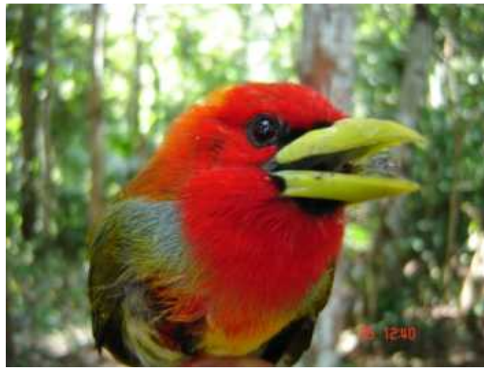
Figura 5 - Eubucco tucinkae (Capitonidae). Espécie endêmica, registrada em território brasileiro, até o momento, apenas no Estado do Acre. Ave capturada no Ponto 5 (07°56'38,4"S; 71° 32'07,9"W), dentro da Floresta Estadual do Mogno.

Felizmente nenhuma das espécies observadas está na lista das aves ameaçadas de extinção divulgadas pelo IBAMA ( http://www.mma.gov.br/port/sbf/fauna/index.cfm ).