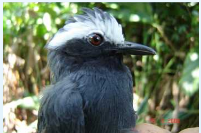
Figura 6. Myrmoborus leucophrys – macho - (Thamnophilidae). Ave capturada no Ponto 1 (07°48'50,9"S; 72°01'37,0"W), dentro da Floresta Estadual do rio Liberdade.

Nas áreas próximas dos pontos onde foram realizadas as observações, não foram detectadas duas espécies de cracídeos que são historicamente utilizadas por ribeirinhos e indígenas como fonte de proteína, são elas: o mutum ( Mitu tuberosum ) e o cubim ( Aburria cumanensis ). Estas aves são indicadoras de qualidade ambiental e, em consequência disso, são as primeiras a desaparecerem de áreas onde exista algum tipo de pressão de caça. Por serem de grande porte, estas espécies ocorrem provavelmente em baixas densidades e necessitam de uma área de vida relativamente grande para manter populações viáveis (Strahl 1987). Este fato pode nos dar um indicio de que existe na região uma pressão moderada de caça, já que, em conversa com moradores locais, obtivemos informações que ambas as espécies ocorrem na região, porém, em áreas mais afastadas das moradias localizadas dentro e/ou nos arredores das áreas protegidas.