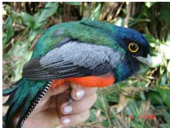
Figura 3 - Trogon curucui –macho- (Trogonidae). Aves capturadas no Ponto 1 (07°48'50,9"S; 72°01'37,0"W), dentro da Floresta Estadual do rio Liberdade

Duas abordagens foram utilizadas para inventariar a avifauna de cada um dos pontos: (a) uma quantitativa, através do uso de cerca de 20 (vinte) redes-de-neblina ( mist-nets ) de 12 m de comprimento por 2 m de altura e