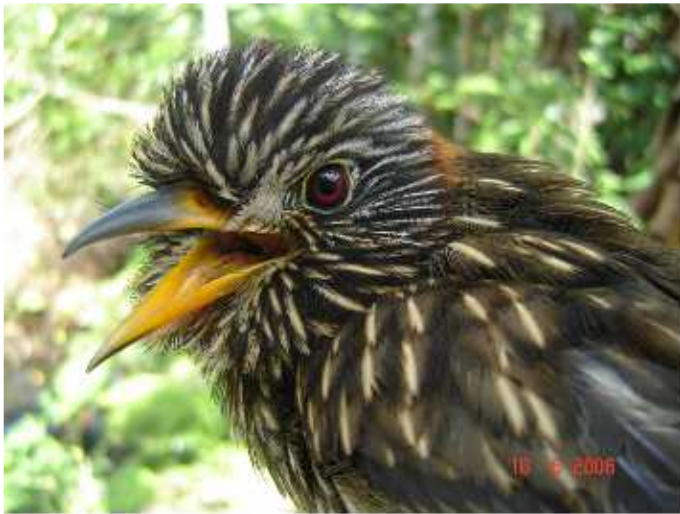
Figura 4 - Malacoptila semicincta – (Bucconidae). Espécie endêmica, capturada no Ponto 5 (07°56'38,4"S; 71°32'07,9"W), dentro da Floresta Estadual do Mogno.