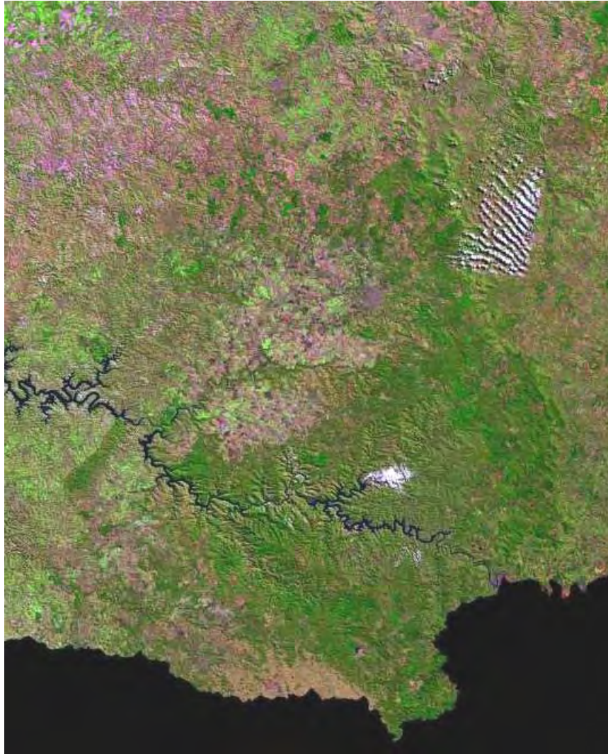
Figura 2. Área de estudo em imagem de satélite, indicando destacadamente o rio Iguazu e seus diversos reservatórios de usinas hidrelétricas, bem como a orografia ondulada da região e alguns extensos maciços florestados, entremeados por campos.

Para os trabalhos de campo utilizou-se as técnicas convencionais em estudos ornitológicos qualitativos: reconhecimento visual com auxílio de binóculos, identificação de vocalizações e captura por meio de redes-neblina ( mist nets ) ou espingardas de caça calibres 20, 32 e 8 mm.